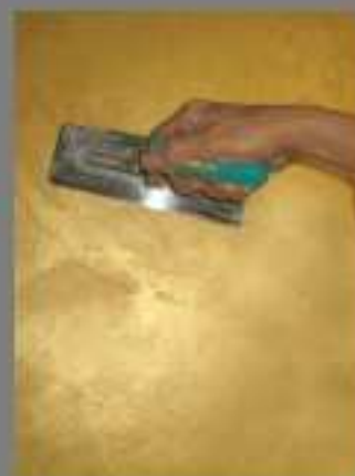
3 a mano Veli d'Oriente (rasato e poi lamato) 3 rd coat Veli d'Oriente (smoothed and bladed)