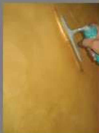
2 a mano Veli d'Oriente (a spatola) 2 nd coat Veli d'Oriente (by spatula)