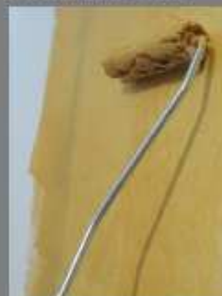
1 a mano Veli d'Oriente (a rullo) 1 st coat Veli d'Oriente (by roller)