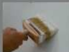
Mano di fondo con SMARTCOAT Ground coat with SMARTCOAT