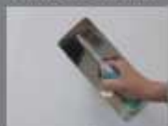
Rasatura con Plastuc Tipo A (Opzionale) Levelling with PLASTUC TIPO A (Optional)